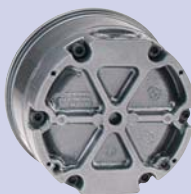
vue arrière du montage en saillie