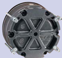
vue arrière du montage encastré